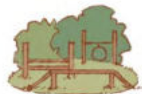
VÝBĚH A PROLÉZAČKY PRO PSY