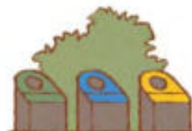
KOŠE NA TŘÍDĚNÝ ODPAD