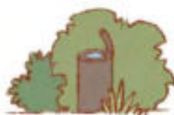
PÍTKO NA VODU